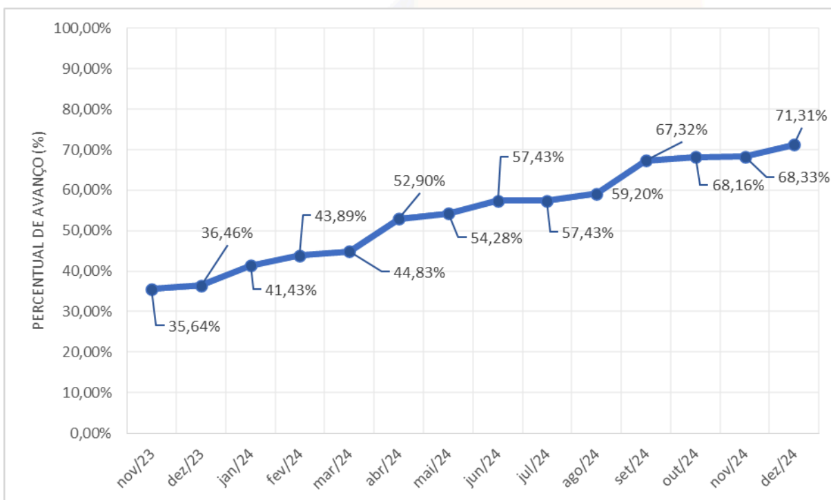
Gráfico 1 - Evolução da carteira de projetos até entre novembro de 2023 a dezembro de 2024